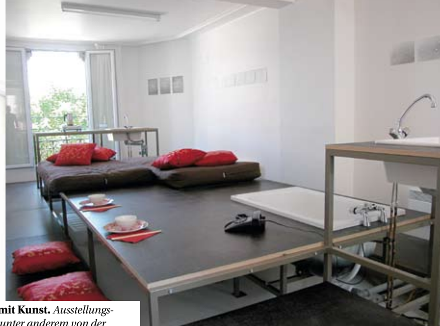
Wohnen mit Kunst. Ausstellungsansichten unter anderem von der aktuellen Schau „ever look back“.