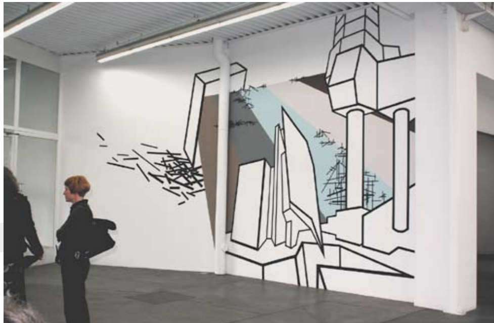
Wandsinstallation mit Klebeband, Dispersion , 500 x 700 cm, Kunsthaus Baselland, Muttenz, 2009